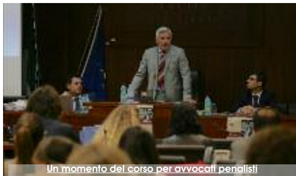
Un momento del corso per avvocati penalisti

Il Corso - che ha avuto inizio nel gennaio 2017 ed è abilitante al rilascio dell'attestazione di idoneità all'iscrizione nell'Elenco unico nazionale dei difensori d'ufficio - ha visto intervenire come docenti figure prestigiose che, ben oltre il mero ruolo didattico-informativo, hanno portato in aula professionalità, comunicatività ed esperienze certamente in grado di "arricchire" sia professionalmente che umanamente coloro i quali hanno seguito con interesse le lezioni e i con-