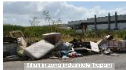
Rifiuti in zona industriale Trapani

Sono pronti a partire gli interventi di diserbo e pulizia delle aree a verde dalle erbacce e sterpaglie nella zona industriale di Trapani. Contro il rischio incendi - particolarmente diffuso nella stagione estiva - l'Ufficio periferico IRSAP di Trapani, dopo un sopralluogo effettuato sui siti di proprietà dell'Ente, ha predisposto interventi d'urgenza di decespugliatura e pulizia generale in alcune fasce ai margini del Canale di Gronda e nelle aree di pertinenza dell'ufficio periferico Irsap di Trapani, al fine di garantire la sicurezza e la salvaguardia della pubblica incolumità. Per permettere l'intervento l'Irsap, Istituto regionale per lo sviluppo delle attività produttive per la zona industriale di Trapani, ha stanziato oltre 20 mila euro, di cui 9.711 per la decespugliatura e la pulizia generale di aree consortili infestate da erbacce, nonché raccolta e trasporto a pubblica di-