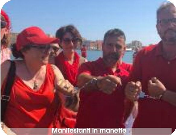
Manifestanti in manette