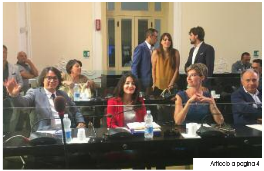
Articolo a pagina 4