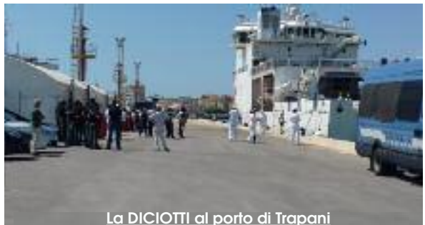
La DICIOTTI al porto di Trapani